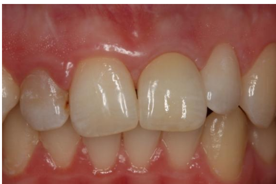
21 implanto cirkonio keramika

Kursų metu planuojami pietūs ir 2 kavos pertraukos. Bus išduodami 8 val sertifikatai, registruoti Odontologų rūmuose.