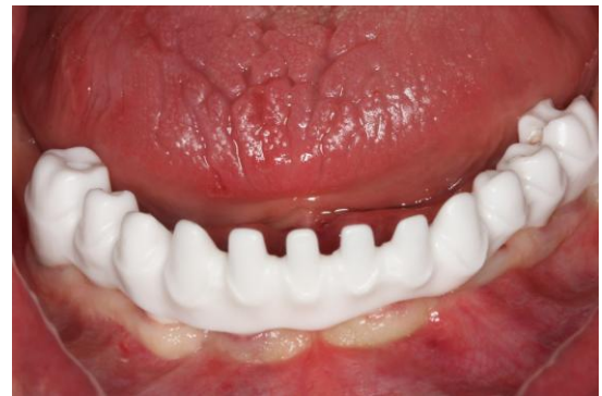
Cirkonio karkasas bedančiams

Protezavimas ant dantų implantų naudojant cirkonio oksidą jau seniai tapo kasdieniu reiškiniu klinikinėje praktikoje. Visiems žinomi cirkonio privalumai – estetika ir puikus biosuderinamumas žinomi gydytojams bei akcentuojami pacientams, skatinant juos pasirinkti būtent šį protezavimo būdą. Tačiau ar tikrai pacientai gauna tai ką mes siūlome? Ar visada cirkonis mūsų protezuose kontaktuoja su dantenomis? Ir ar nebūna taip, kad pacientams padarome cirkonį be cirkonio...?